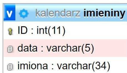
Ilustracja 1. Baza danych

Baza danych zawiera tabelę imieniny przedstawioną na ilustracji 1. Data zapisana jest w formacie mm-dd , np. data 7 listopada zapisana jest jako 11-07.